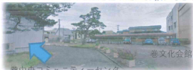
巻中央コミュニティセンター