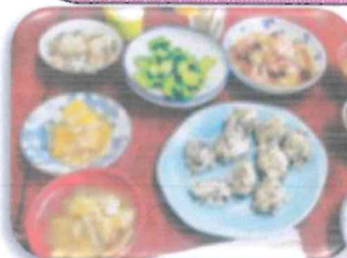
にしかんの茶の間で