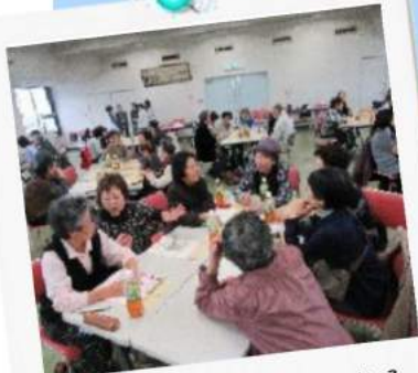
「助けられ上手さんになるために」のグループワーク