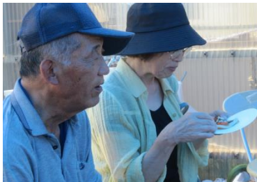
初めて参加されたご夫婦

今回は木炭を使用したが、火お越しの難しさを実感しながら、薪と組み合わせて「火を起こした方がいい」といった次に向けたアイデアも生まれた。