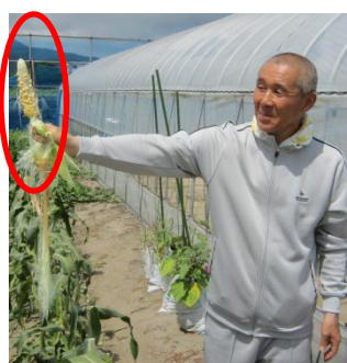
個性的なとうもろこしも