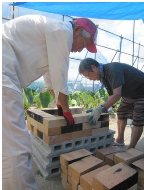
レンガの積み上げ作業