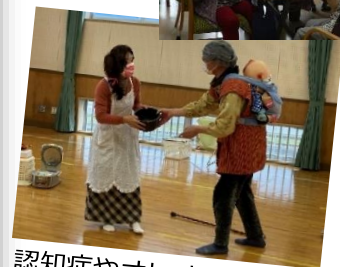
認知症やオレオレ詐欺の寸劇