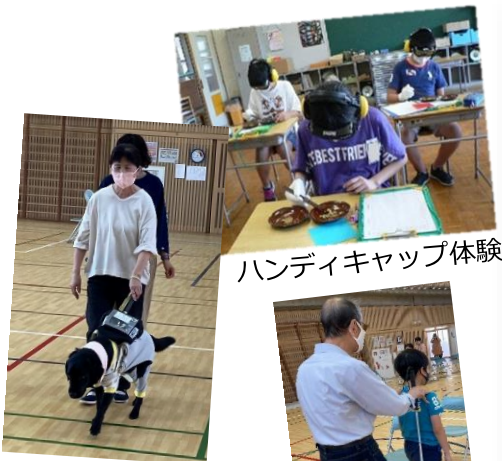
ハンディキャップ体験