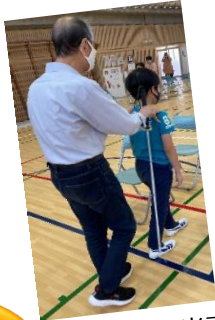
視覚障がい当事者の誘導歩行体験