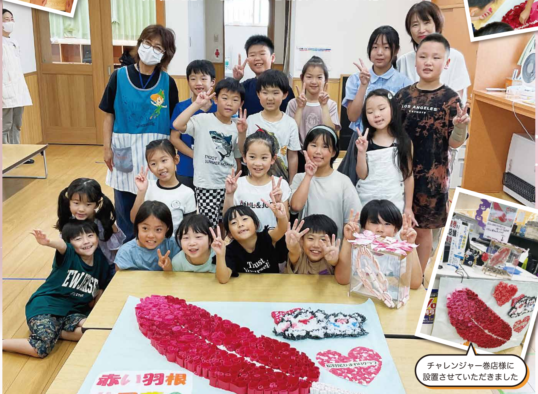
チャレンジャー巻店様に 設置させていただきました

松野尾ひまわりクラブの子どもたちと一緒に赤い羽根共同募金のポスターを制作! 募金の仕組みを学び、福祉への関心を深める貴重な機会となりました。 この取り組みを通じて地域の福祉に目を向けてもらえたら嬉しいです🍀😊